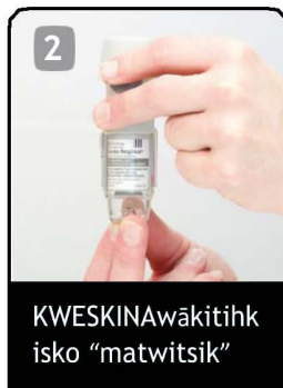
KWESKINA wākitihk isko "matwitsik"