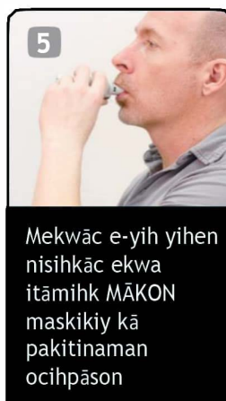
Mewāc e-yih yihen nisihkēc ekwa itāmihk MĀKON maskikiy kā pakitinaman ocīhpāson