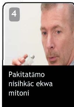
Pakitātāmo nisihkēc ekwa mitoni