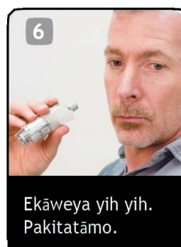
Ekāweya yih yih. Pakitātāmo.