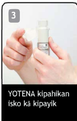
YOTENA kipahikan isko kā kipayik